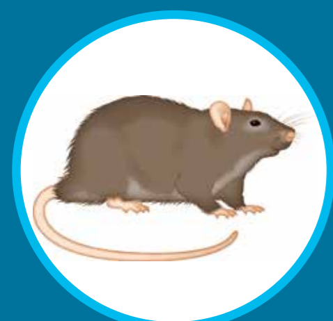
Rat noir Rattus rattus