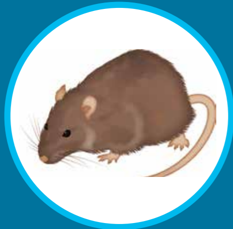
Rat brun Rattus norvegicus